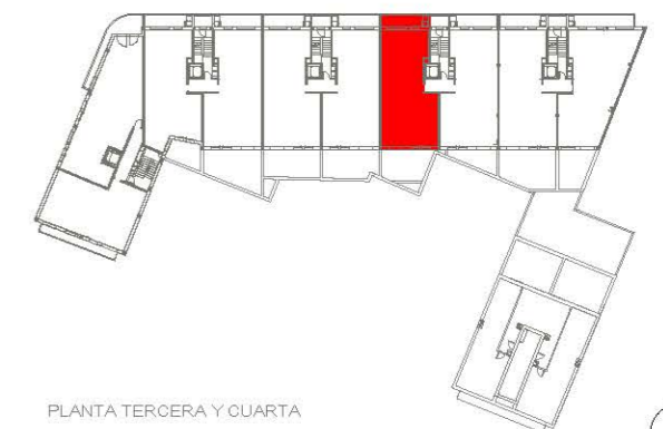
PLANTA TERCERA Y CUARTA